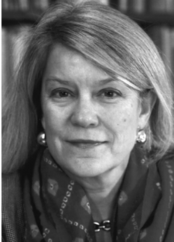
Diana L. Eck

apreciar las dimensiones y alcance de ese cambio, tan gradual — y, sin embargo, tan colosal — ha sido. Comenzó con la "nueva inmigración", estimulada por la Ley de Inmigración y Naturalización de 1965, a medida que gentes de todas partes del mundo vinieron a Norteamérica y se convirtieron en ciudadanos. Con ellas llegaron las tradiciones religiosas de todo el mundo — islámica, hindú, budista, jaína, sij, zoroastriana, africana y afrocaribeña. La gente de estas vivas tradiciones de fe entró en los vecindarios norteamericanos, de modo tentativo al principio, con sus altares y oratorios instalados en comercios y edificios de oficinas, sótanos y garages, salas de recreación y guardarropas, casi invisibles para el resto de nosotros. Pero en la última década hemos empezado a sentir su presencia visible. No todos hemos visto la mezquita de Toledo o el templo de Nashville, pero vemos lugares como esos, si prestamos atención, incluso en nuestras propias comunidades. Son las señales arquitectónicas de una nueva Norteamérica religiosa.